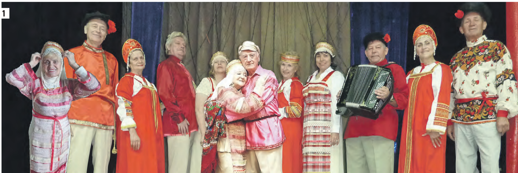
1 «Нам Лет Нет», господа! Нам лет — нет, и не будет! Годы есть состояние каждой души. Не сдавайтесь! Боритесь! Помните люди: Только делать добро в этой жизни спешит!» — с таких слов начинается каждое свое выступление арт-группы «Нам Лет Нет» 2 Литературно-музыкальные композиции — основной и любимый артистами группы «Нам Лет Нет» жанр

сой, овощами, хлебом, яйцами по доступным ценам. К слову, 20 автолавок будут оформлены в едином дизайне. Пилотный проект продлится два месяца. Если торговля с колес будет пользоваться у горожан популярностью, с нового года сеть охватит весь мегаполис.